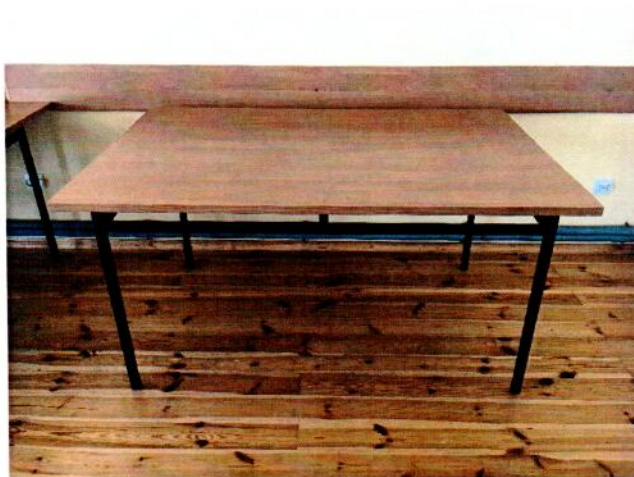
rys.2. stół duży – rysunek przykładowy

Podstawa metalowa, spawana, wymiary blatu: szer. min. 90 cm, dł. 180 cm, gr. 22-28 mm, wys. całkowita: 75-77 cm kolorystyka blatu: jasna (min. 3 propozycje do wyboru)