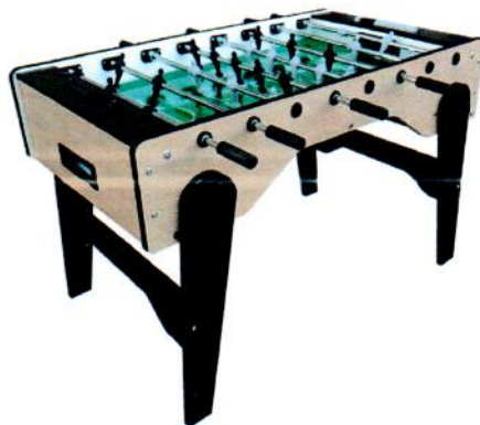
rys.7. piłkarzyki – rysunek przykładowy

wymiary (dł. x szer. x wys.): 137x110x90 cm waga: 70 kg przewodnice teleskopowe zawodnicy odlewani bezpośrednio na przewodnicy