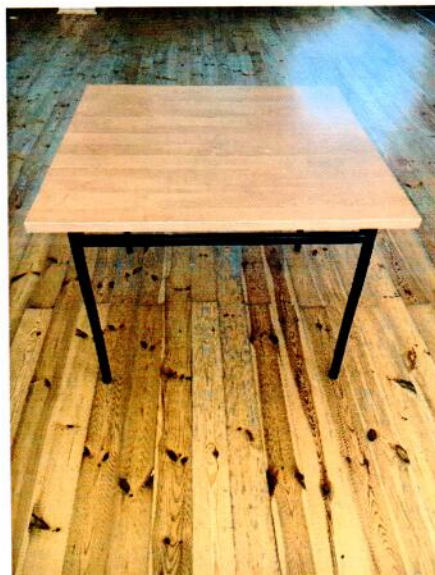
rys.3. stół mały – rysunek przykładowy

Podstawa metalowa, spawana, wymiary blatu: szer. min. 90 cm, dł. 90 cm, gr. 22-28 mm, wys. całkowita: 75-77 cm kolorystyka blatu: jasna (min. 3 propozycje do wyboru)