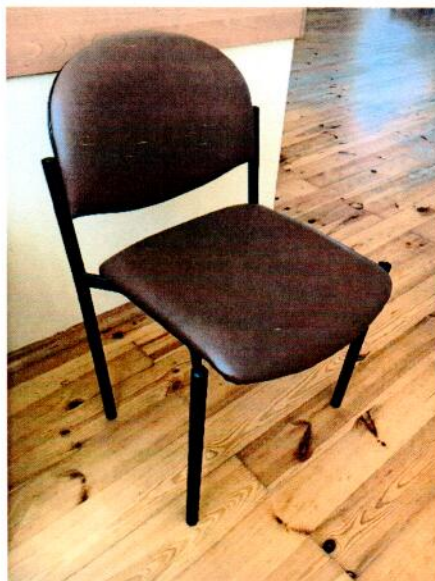
rys.1. krzesło – rysunek przykładowy

wymiary siedziska: szer. 42-46 cm, gł. 42-47 cm, wys. oparcia: 32-36 cm, wys. całkowita: 80-85 cm. Siedzisko tapicerowane ekoskórą, kolor brąz.