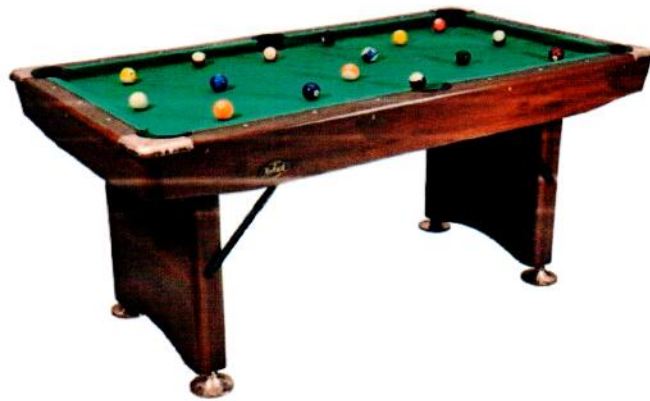
rys.6. stół bilardowy – rysunek przykładowy