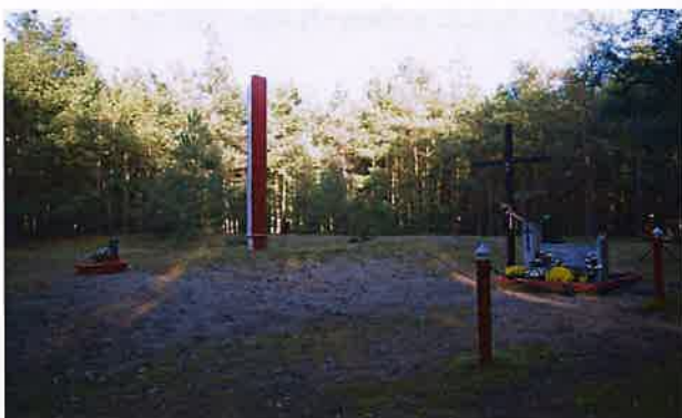
3) Cmentarz ofiar hitleryzmu z II wojny światowej wraz z nagrobkami w Klamrach (forma ochrony: A/223 z dnia 01.06.1987 r.)