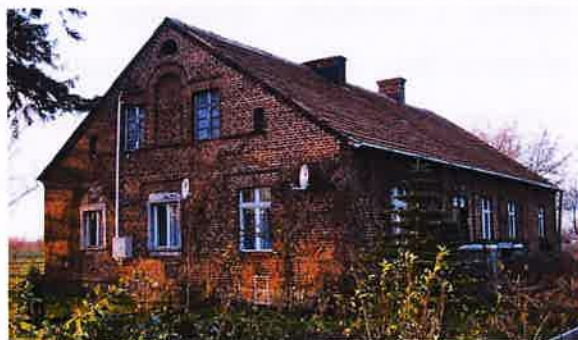
Zdj. 24 – Dom z początku XX wieku.