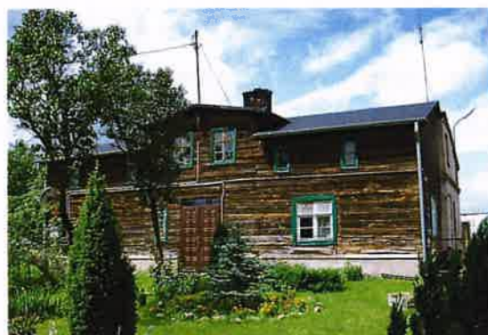
Zdj. 2 – Dom we wsi Bieńkówka z okresu 1 połowa XIX wieku.

Na obszarze wsi występują zachowane wartości obiekty o wartości kulturowej w tym zachowany dom z okresu 1 połowy XIX wieku (Zdj. 2), a także przydrożna kapliczka która stanowi jedną z wielu charakteryzujących kulturowo obszar Gminy (Zdj. 3).