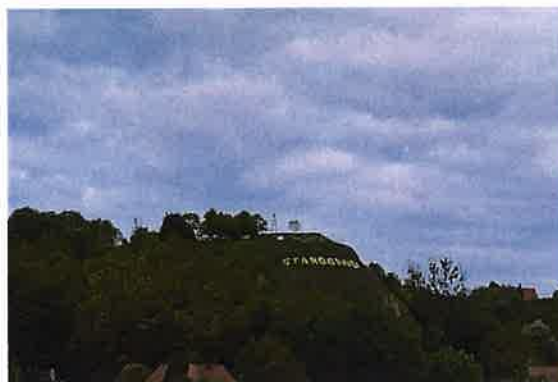
Zdj. 34 – Góra zamkowa z pozostałościami murów z XIV wieku.

Drogi dochodzące do wsi o znacznie rozbudowanym układzie historycznym, posiadają zadrzewienia (szczególnie biegnąca w kierunku północnym do Kałdusa i Chełmna, malownicza serpentina, schodząca w dolinę, dalej zakręcająca w kierunku południowym biegnąc u podnóża skarpy i wzgórza zamkowego). Oprócz eksponowanego wzgórza zamkowego, wolnego od wysokiej zieleni, cała krawędź starogrodzka jest zadrzewiona.