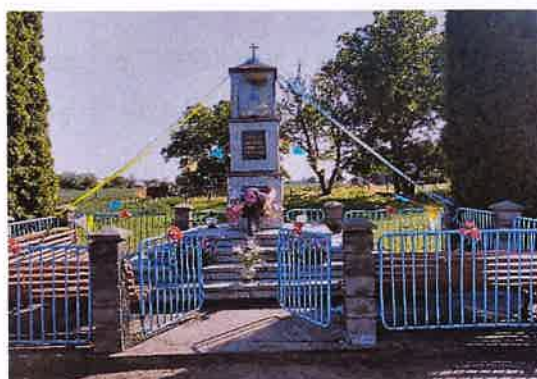
Zdj. 3 – Kapliczka we wsi Bieńkówka.