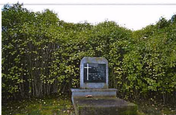
5) Cmentarz ewangelicki „nowy” w Klamrach (forma ochrony: A/225 z dnia 01.06.1987 r. wyjaśnienie treści decyzji z 14.01.2008 r.)