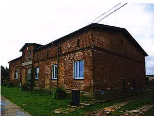
Zdj. 13 – Dom z 2 połowy XIX wieku, przebudowany w XX wieku.

Wieś o metryce średniowiecznej, pierwsza wzmianka źródłowa pochodzi z 1378 r. W czasach krzyżackich wieś z folwarkiem jest własnością Zakonu w komturstwie starogrodzkim. W 1505 r. Aleksander Jagiellończyk przekazał okręg starogrodzki, w tym wieś Kałdus, biskupowi chełmińskiemu. W 1570 r. wieś stanowiła własność biskupstwa chełmińskiego, w XVII i XVIII w. wydana w wieloletnią dzierżawę. Po sekularyzacji