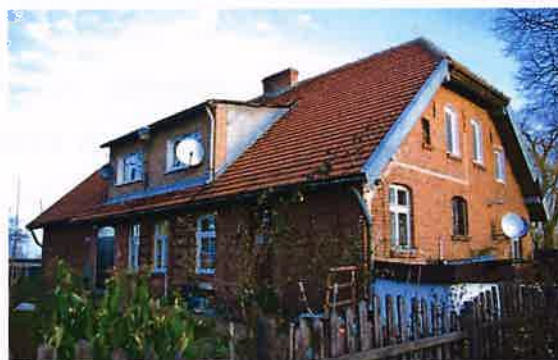
Zdj. 23 – Dawna szkoła z ok. 1913 roku.