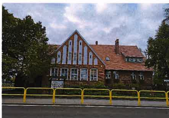
Zdj. 32 – Szkoła z początku XIX wieku.