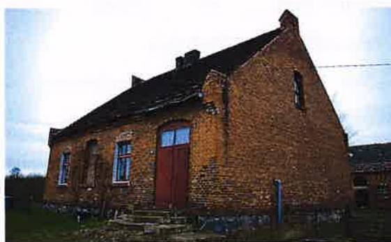
Zdj. 15 – Dawna szkoła, ob. budynek mieszkalny z 1898 rok.

Na terenie wsi występują zachowane wartości obiekty o wartości kulturowej w tym dawna szkoła, obecnie budynek mieszkalny z 1898 rok (Zdj. 15), a także dawna szkoła, obecnie budynek mieszkalny z 1911 roku (Zdj. 16) oraz jeden