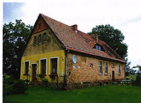
Zdj. 28 – Dawna szkoła, obecnie budynek mieszkalny z 1913 roku.

Wieś złożona na gruntach należących do miasta Świecia w XVII w. zasiedlona przez osadników holenderskich – mennonitów. 1773 r. liczyła 322 mieszkańców, w tym 48 gospodarzy czynszowych, 6 rzemieślników i 1 zagrodnik. W 1873 r. wzmiankowany jest przewóz przez Wisłę, oznaczony już w źródłach kartograficznych z końca XVII w. W 1890 r. do wsi należało 589 ha obszaru, była szkoła podstawowa. Przynależność do parafii katolickiej i ewangelickiej w Świeciu.