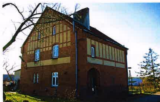
Zdj. 16 – Dawna szkoła, ob. budynek mieszkalny z 1911 roku.