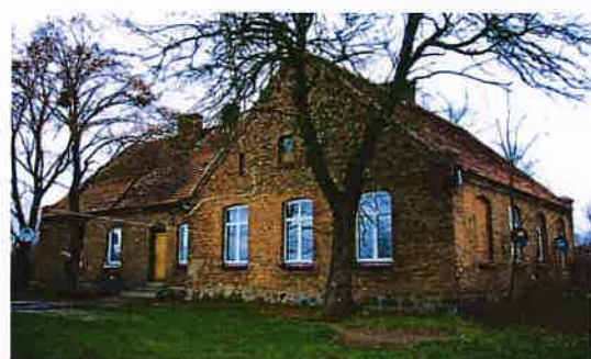
Zdj. 19 – Dawna szkoła z ok. 1913 roku.