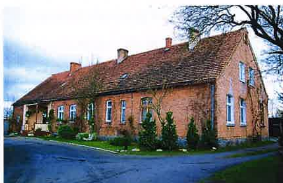
Zdj. 8 – Budynek starej szkoły z ok. 1908 roku.

Na terenie wsi występują zachowane wartości obiekty o wartości kulturowej w tym budynek starej szkoły z ok. 1908 roku (Zdj. 8), a także zachowany dom wraz z budynkiem inwentarskim ok. 1900 roku (Zdj. 9).