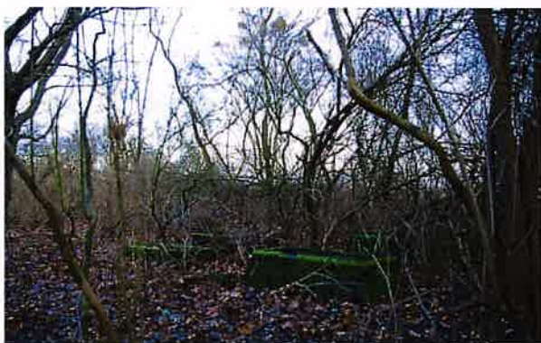
8) Cmentarz ewangelicki w Małych Lunawach (forma ochrony: A/221 z dnia 01.06.1987 r.)