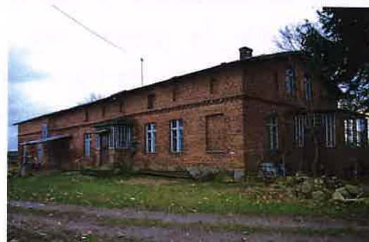
Zdj. 12 – Dom z budynkiem gospodarczym z końca XIX wieku.