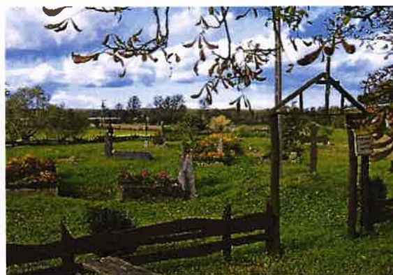
Zdj. 35 – Cmentarz mennonicki z połowy XIX wieku.

We wsi były: kościół ewangelicki zbudowany w 1885 r. i siedziba parafii ewangelickiej, ewangelicka szkoła 2-klasowa, młyn wodny i karczma. Przynależność do parafii katolickiej w Wabczu, ewangelickiej na miejscu i mennonickiej w Sosnowce.