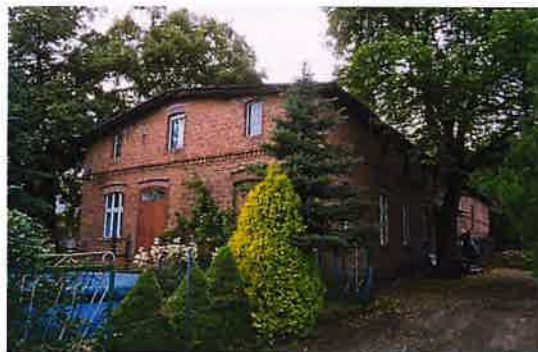
Zdj. 18 – Dom z koniec XIX wieku.

Wieś położona na gruntach należących do miasta Chełmna, elokowanych mieszczanom chełmińskim od 1602 r. W XVII w. osiedlili się tu także osadnicy holenderscy – menonici. W 1773 r. wieś liczyła 46 mieszkańców. W 1905 r. do wsi należało 166,3 ha gruntów, a do obszaru dworskiego Eichwald – 196,2 ha. We wsi była szkoła Podstawowa 2 – klasowa (w budynku drewnianym, nieistniejącym, opodal obecnego budynku szkolnego). Przynależność do parafii katolickiej w Chełmnie i ewangelickiej w Wielkich Łunawach (od 1885 r.). Na obszarze wsi znajdował się dom wraz z salą taneczną z początku XX wieku (Zdj. 20), a także dawna szkoła z ok. 1912 roku (Zdj. 21).