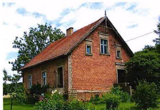
Zdj. 36 – Dom przełom XIX / XX wiek.