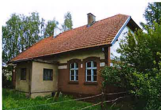
Zdj. 29 – Poczta z początku XIX wieku.

Wieś nadana w 1222 r. biskupowi Christianowi przez Konrada Mazowieckiego. Wcześniej (schyłek XII w.) w posiadaniu komesa Żyry. W 1322 r. terytorium miasta Chełmna; zgodnie z zarządzeniem miasta Chełmna dla wsi Kolno i Podwiesiek, leżących na terenach przeznaczonych na pastwiska rolę, gospodarstwo nie może mieć więcej niż 3 łany, na których ma być 1 gospodarz i 2 zagrodników. W 1505 r. Podwiesiek z całym terytorium miasta Chełmna przyszedł we władanie biskupstwa chełmińskiego. W XVII w. osiedlili się tu osadnicy holenderscy – menonicy. W 1773 r. w Podwiesku było 146 mieszkańców. W 1887 r. wieś obejmowała 1998,32 mórg magdeburskich obszaru, istniały 2 młyny zbożowe (wiatraki),