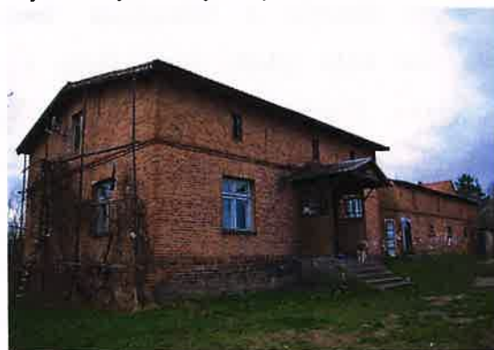
Zdj. 9 – Budynek inwentarski z ok. 1900 roku.