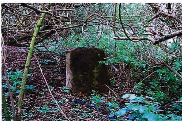
4) Cmentarz ewangelicki „stary” w Klamrach (forma ochrony: A/224 z dnia 01.06.1987 r.)