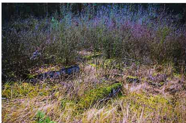
7) Cmentarz ewangelicki w Kolnie (forma ochrony: A/222 z dnia 01.06.1987 r.)