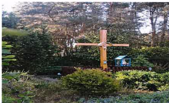
Zdj. 6 – Kapliczka we wsi Różnowo.

Na terenie Różnowa zlokalizowana jest przydrożną kapliczkę (Zdj. 6), a także zachowany budynek dawnej szkoły z przełomu XIX/XX wieku (Zdj.7)