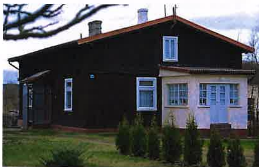
Zdj. 11 – Dom drewniany z początku XX wieku.

Na terenie wsi występują zachowane wartości obiekty o wartości kulturowej w tym dom drewniany z początku XX wieku (Zdj. 11), a także dom z budynkiem gospodarczym z końca XIX wieku (Zdj. 12)