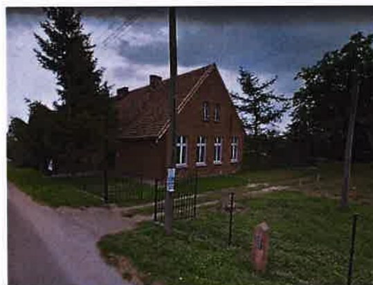
Zdj. 10 – Dawna szkoła z ok. 1912 roku.

We wsi znajduje się między innymi zachowany budynek dawnej szkoły z ok. 1912 roku (Zdj. 10).