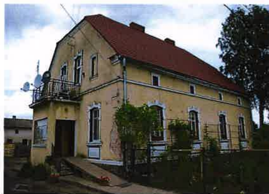
Zdj. 5 – Dom we wsi Borówno z początku XX wieku.