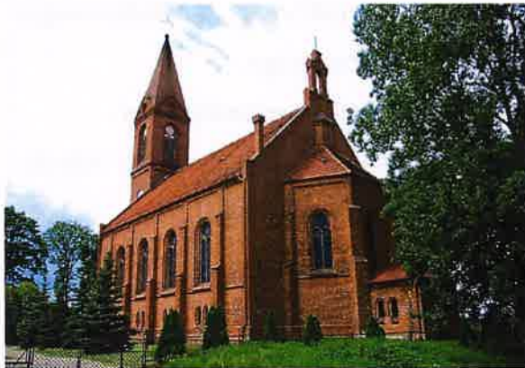
11) Kościół ewangelicki, obecnie rzymskokatolicki parafialny pw. Wniebowzięcia NMP w Małych Łunawach otoczenie kościoła wraz z częścią działki nr 188/20, obr. 0018 (forma ochrony: A/1689 z dnia 07.12.2015 r.)