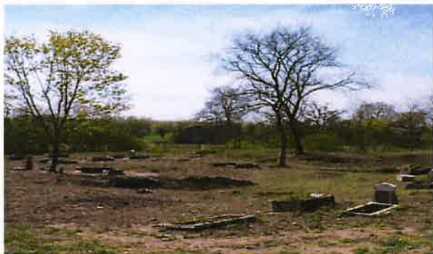
1) Cmentarz ewangelicki w dawnym zaborze w Dolnych Wymiarach (forma ochrony: A/227 z dnia 01.06.1987 r.)