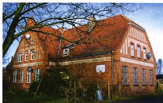
Zdj. 21 – Dawna szkoła z ok. 1912 roku.