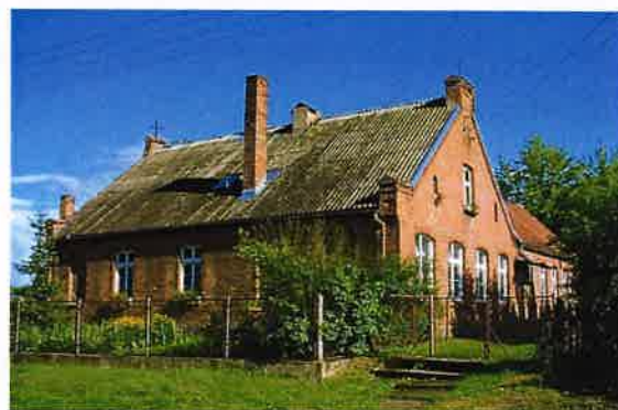
Zdj. 27 – Dawna szkoła z ok. 1913 roku.

Na terenie miejscowości występują zachowane wartości obiekty o wartości kulturowej w tym dom z 1876 r. (Zdj. 26), a także dawna szkoła z ok. 1913 roku (Zdj. 27).