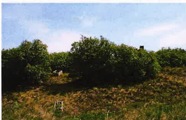
2) Cmentarz ewangelicki przy dawnym zborze w Dolkach (forma ochrony: A/226 z dnia 01.06.1987 r.)