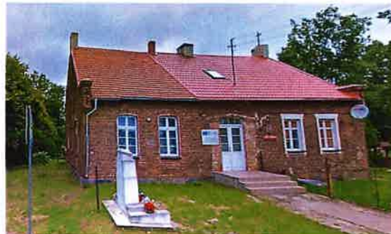
Zdj. 7 – Dawna szkoła z przełomu XIX / XX wiek.