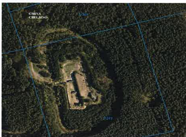
6) Zespół fortyfikacji twierdzy Chełmno – Front VIII im. Piłsudskiego w Klamrach (forma ochrony: A/1511 dnia 14.02.1980 r.)