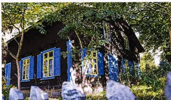
Zdj. 25 – Dom drewniany z 2 połowy XIX wieku.