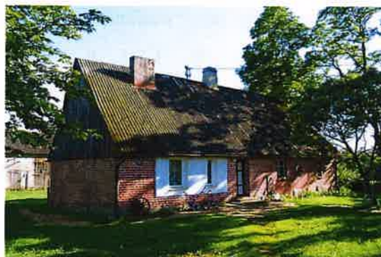
Zdj. 26 – Dom z 1876 r.

Wieś założona na przełomie XII i XVIII w. na terenach należących do miasta Chełmna, elokowanych mieszczanom od 1602 r. Nie zamieszczono danych wsi w pruskim katastrze podatkowym z 1773 r., ponieważ grunty w Nowych Dobrach uprawiali mieszcianie chełmińscy i zakładali tu folwarki. W 1886 r. wg informacji podanych w SGKP istniały dwie wsie: wieś Wielkie Nowe Dobra oraz Małe Nowe Dobra. W Wielkich Nowych Dobrach była szkoła ewangelicka 2-klasowa. Przynależność do parafii katolickiej w Chełmnie. W 1921 we wsi były dwa młyny zbożowe (wiatraki) oraz młyn motorowo-parowy z tartakiem, zbudowany w 1891 r., własność firmy A. Meseck i W. Schultze, jeden z większych młynów w powiecie chełmińskim.