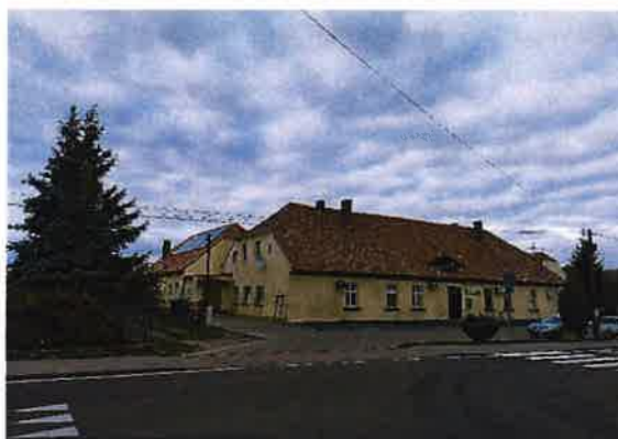
Zdj. 31 – Karczma, ob. budynek mieszkalny, świetlica wiejska z początku XIX wieku.