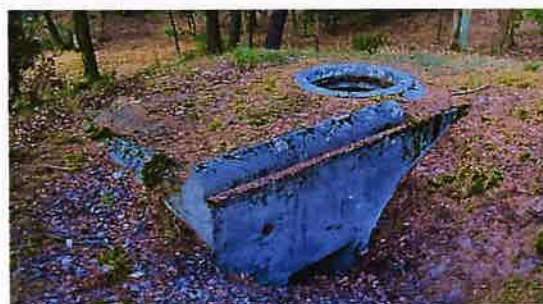
Zdj. 17 – obiekt nr 31 schron typ RINGSTAND RS 58C "Tobruk".

z trzech zachowanych schronów twierdza Chełmno - zespół fortyfikacji polowych z 1944 roku – obiekt nr 31 schron typ RINGSTAND RS 58C "Tobruk" (Zdj. 17)