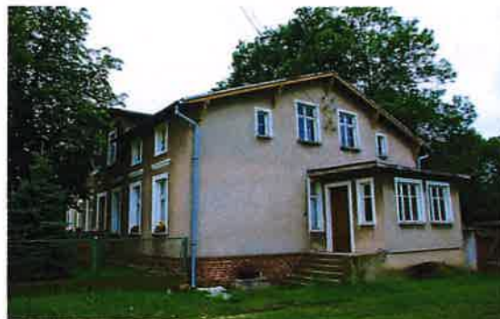
Zdj. 4 – Dom we wsi Borówno z 1873 roku.

Na terenie wsi zachowane zostały obiekty o wartości kulturowej w tym zachowany dom z 1873 roku (Zdj. 4), a także dom z początku XX wieku (Zdj. 5).