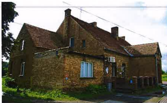
Zdj. 14 – Karczma z 2 połowa XIX wieku, przebudowany w XX wieku.

Na obszarze sołectwa występują zachowane wartości obiekty o wartości kulturowej w tym dom z 2 połowy XIX wieku, przebudowany w XX wieku (Zdj. 13), a także zachowana karczma z 2 połowy XIX wieku, przebudowy w XX wieku (Zdj. 14).