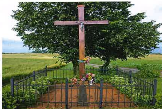
Zdj. 1 – Cmentarz choleryczny z 2 połowy XIX wieku.

Na obszarze Osnowa występuje zachowany obiekt o wartości kulturowej – cmentarz choleryczny z 2 połowy XIX wieku (Zdj. 1).