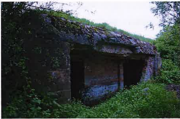
10) Zespół fortyfikacji Twierdzy Chełmno – schron amunicyjny M-1 w Starogrodzie (forma ochrony: A/1511 z dnia 14.02.1980 r.)