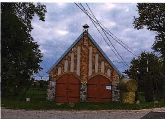
Zdj. 33 – Remiza z początku XX wieku.