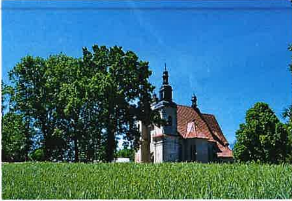
9) Kościół parafialny p.w. św. Barbary w Starogrodzie (forma ochrony: A/387 z dnia 30.11.1929 r.)