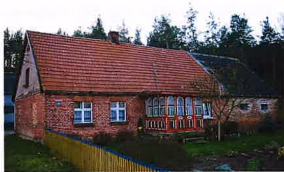
Zdj. 22 – Dom z końca XIX wieku.

W miejscowości występują zachowane wartości obiekty o wartości kulturowej w tym dom z końca XIX wieku (Zdj. 22), a także dawna szkoła z ok. 1913 roku (Zdj. 23)