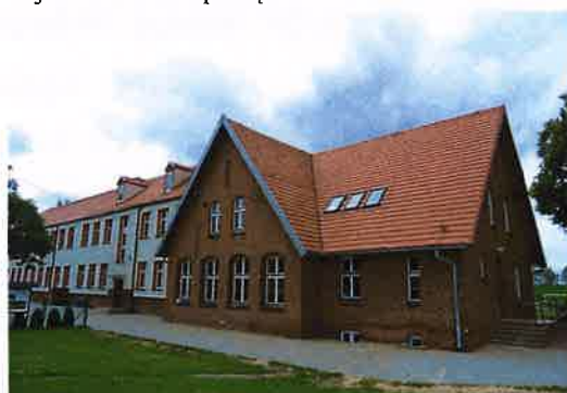
Zdj. 30 – Szkoła powstała ok. 1909 rok.

agentura pocztowa i szkoła podstawowa ewangelicka 1-klasowa. Przynależność do parafii katolickiej w Chełmnie i ewangelickiej w Wielkich Łunawach.