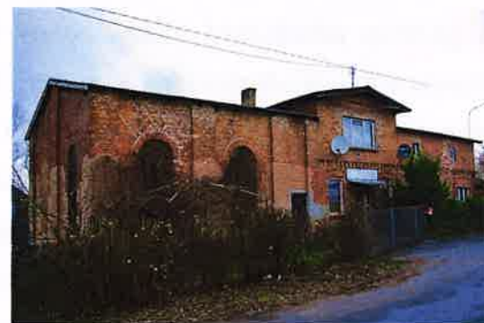
Zdj. 20 – Dom wraz z salą taneczną z początku XX wieku.