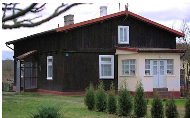
Zdj. 11 – Dom drewniany z początku XX wieku.

Na terenie wsi występują zachowane wartości obiekty o wartości kulturowej w tym dom drewniany z początku XX wieku (Zdj. 11), a także dom z budynkiem gospodarczym z końca XIX wieku (Zdj. 12)