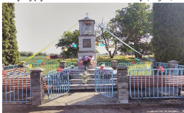
Zdj. 2 – Kapliczka we wsi Bieńkówka.