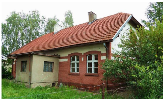
Zdj. 30 – Szkoła powstała ok. 1909 rok.