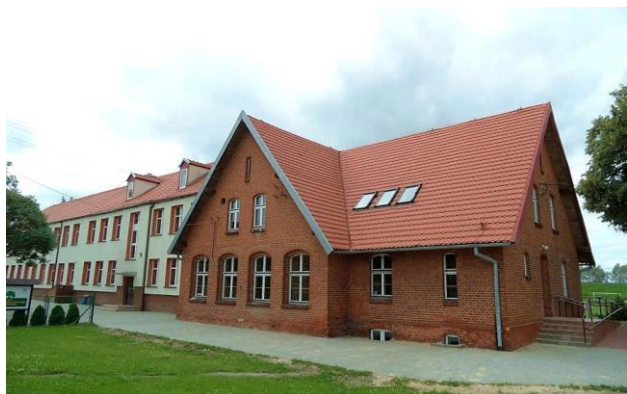
Zdj. 29 – Poczta z początku XIX wieku.