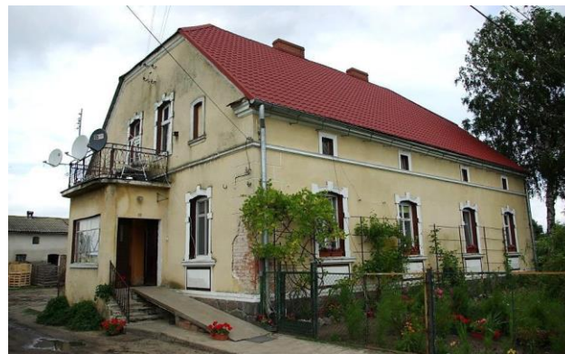
Zdj. 5 – Dom we wsi Borówno z początku XX wieku.