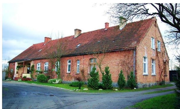
Zdj. 8 – Budynek starej szkoły z ok. 1908 roku.

Wieś założona na gruntach należących do miasta Chełmna, elokowanych mieszczanom od 1602 r. W XVII w. zasiedlona przez osadników holenderskich – menonitów, dzierżawiących grunta elokacyjne na podstawie długoterminowych kontraktów. Według danych z pruskiego katastru podatkowego z 1773 r. wieś liczyła 139 mieszkańców. W 1885 r. do Wsi należało 336 ha gruntów oraz 45 ha na tzw. wybudowaniu. We wsi znajdowała się szkoła ewangelicka. Przynależność do parafii katolickiej w Chełmnie i ewangelickiej w Wielkich Łunawach. Na terenie wsi występują zachowane wartości obiekty o wartości kulturowej w tym budynek starej szkoły z ok. 1908 roku (Zdj. 8), a także zachowany dom wraz z budynkiem inwentarskim ok. 1900 roku (Zdj. 9).