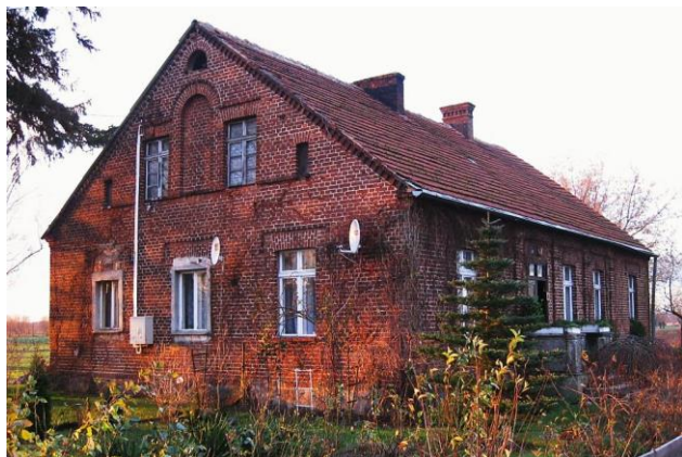
Zdj. 24 – Dom z początku XX wieku.

Wieś o metryce średniowiecznej, własność miasta Chełmna. Pierwsza wzmianka wsi w dokumencie z 1396 r. układu kapituły chełmińskiej z radą miasta Chełmna dotyczącym biskupiego korca ze wsi miejskiej Neudorf. W XVI w. (od 1505 r.) terytorium i własność biskupstwa chełmińskiego. W 1519 r. biskup chełmiński Jan Konopacki nadał wieś kościołowi parafialnemu w Chełmnie. W 1751 r. zasiedlona przez mennonitów. W 1773 r. liczyła 112 mieszkańców. W 1886 r. posiadała szkołę podstawową. Przynależność do parafii katolickiej w Chełmnie i ewangelickiej w Wielkich Łunawach. Na terenie wsi występują zachowane wartości obiektu o wartości kulturowej w tym dom z początku XX wieku (Zdj. 24), a także dom drewniany z 2 połowy XIX wieku (Zdj. 25).