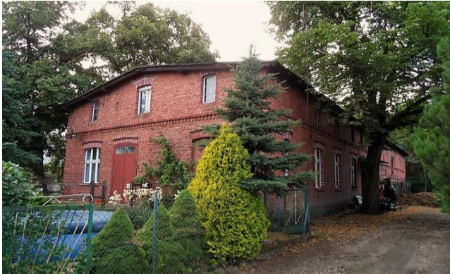
Zdj. 18 – Dom z koniec XIX wieku.

We wsi znajdują się zachowane wartości obiekty o wartości kulturowej w tym dom z końca XIX wieku (Zdj. 18), a także dawna szkoła z ok. 1913 roku (Zdj. 19)