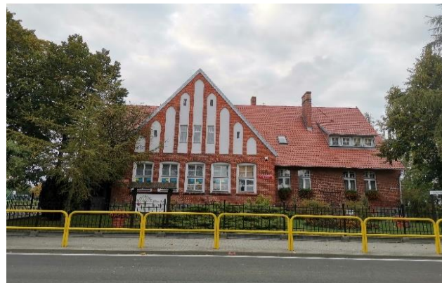
Zdj. 32 – Szkoła z początku XIX wieku.