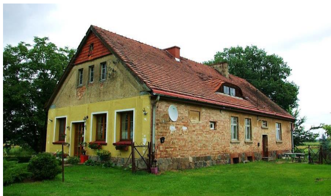
Zdj. 28 – Dawna szkoła, obecnie budynek mieszkalny z 1913 roku.

Wieś złożona na gruntach należących do miasta Świecia w XVII w. zasiedlona przez osadników holenderskich – mennonitów. 1773 r. liczyła 322 mieszkańców, w tym 48 gospodarzy czynszowych, 6 rzemieślników i 1 zagrodnik. W 1873 r. wzmiankowany jest przewóz przez Wisłę, oznaczony już w źródłach kartograficznych z końca XVII w. W 1890 r. do wsi należało 589 ha obszaru, była szkoła podstawowa. Przynależność do parafii katolickiej i ewangelickiej w Świeciu. W granicach wsi występują zachowane wartości obiekty o wartości kulturowej w tym dawna szkoła, obecnie budynek mieszkalny z 1913 roku (Zdj. 28)