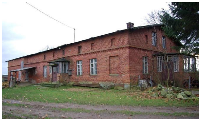
Zdj. 12 – Dom z budynkiem gospodarczym z końca XIX wieku.