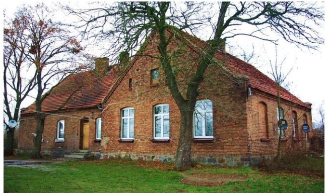
Zdj. 19 – Dawna szkoła z ok. 1913 roku.