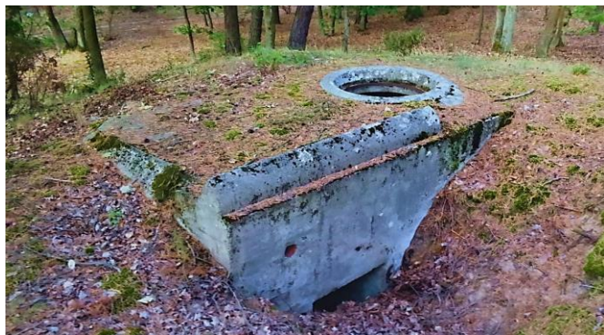
Zdj. 17 – Obiekt nr 31 schron typ RINGSTAND RS 58C "Tobruk".