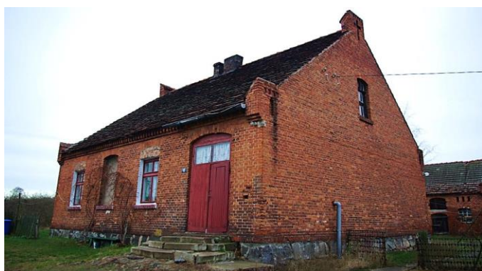
Zdj. 15 – Dawna szkoła, ob. budynek mieszkalny z 1898 rok.

Na terenie wsi występują zachowane wartości obiekty o wartości kulturowej w tym dawna szkoła, obecnie budynek mieszkalny z 1898 rok (Zdj. 15), a także dawna szkoła, obecnie budynek mieszkalny z 1911 roku (Zdj. 16) oraz jeden z trzech zachowanych schronów twierdza Chełmno - zespół fortyfikacji polowych z 1944 roku – obiekt nr 31 schron typ RINGSTAND RS 58C "Tobruk" (Zdj. 17)