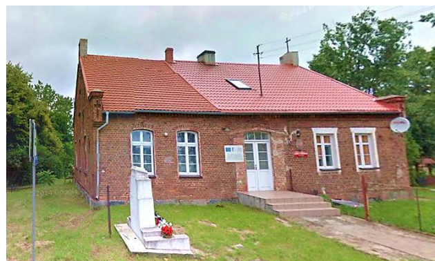
Zdj. 7 – Dawna szkoła z przełomu XIX / XX wiek.