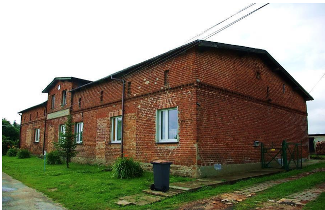
Zdj. 13 – Dom z 2 połowy XIX wieku, przebudowany w XX wieku.