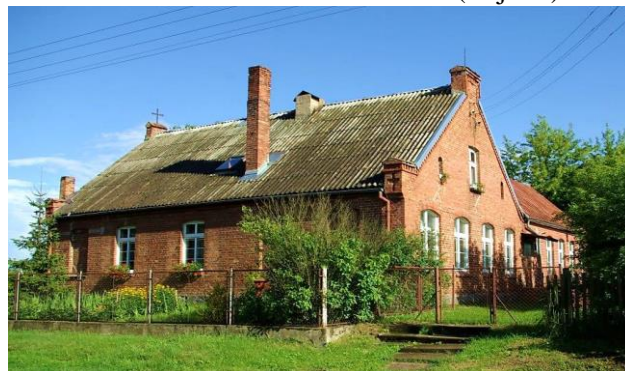
Zdj. 27 – Dawna szkoła z ok. 1913 roku.