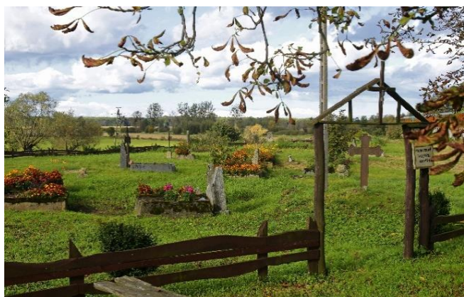
Zdj. 35 – Cmentarz menonicki z połowy XVIII wieku.

We wsi występują zachowane wartości obiekty o wartości kulturowej w tym cmentarz menonicki z połowy XVIII wieku (Zdj. 35), a także między innymi dom z przełomu XIX / XX wiek (Zdj. 36).