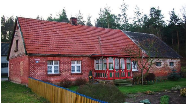
Zdj. 22 – Dom z końca XIX wieku.