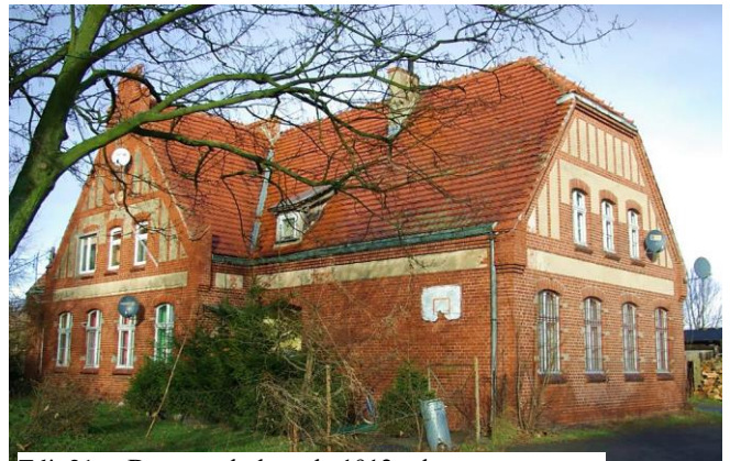
Zdj. 21 – Dawna szkoła z ok. 1912 roku.