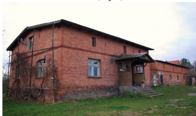
Zdj. 9 – Budynek inwentarski z ok. 1900 roku.