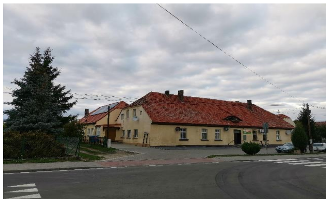
Zdj. 31 – Karczma, ob. budynek mieszkalny, świetlica wiejska z początku XIX wieku.

Na terenie wsi występują zachowane wartości obiekty o wartości kulturowej w tym karczma, obecnie budynek mieszkalny, świetlica wiejska z początku XIX wieku (Zdj. 31), a także szkoła z początku XIX wieku (Zdj. 32), remiza z początku XX wieku (Zdj. 33) oraz góra zamkowa z pozostałościami murów z XIV wieku (Zdj. 34).