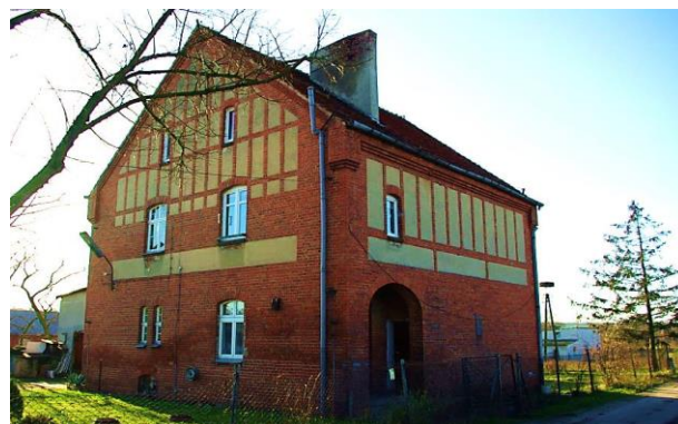
Zdj. 16 – Dawna szkoła, ob. budynek mieszkalny z 1911 roku.