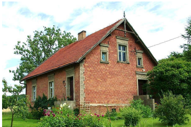
Zdj. 36 – Dom przełomu XIX / XX wiek.