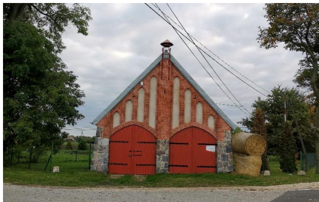
Zdj. 33 – Remiza z początku XX wieku.