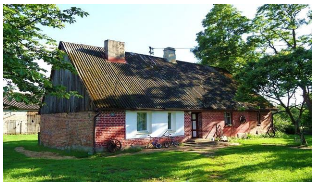
Zdj. 26 – Dom z 1876 r.