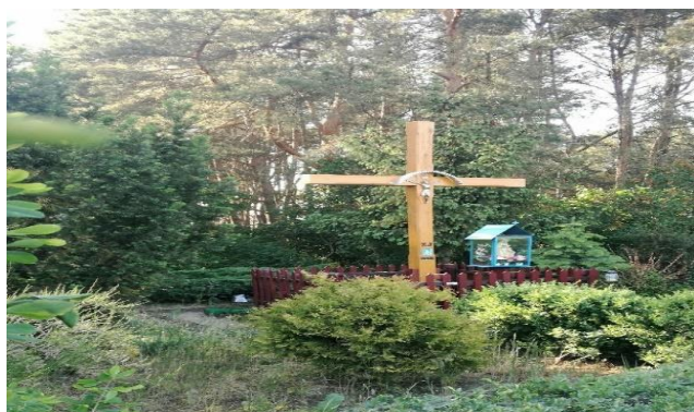
Zdj. 6 – Kapliczka we wsi Różnowo.

Wieś złożona w 1602 r. na nizinie nadwiślańskiej w dobrach biskupstwa chełmińskiego Zasielona przez osadników holenderskich – menonitów, sprowadzonych do Różnowa przez biskupa chełmińskiego. W 1888 r. do wsi należało 473 ha obszaru, w tym 230 ha łąk i 210 ha roli ornej. We wsi była szkoła ewangelicka. Przynależność do parafii katolickiej w Starogrodzie, ewangelickiej w Kokocku i menonickiej w Sosnowce. Na terenie Różnowa zlokalizowana jest przydrożną kapliczkę (Zdj. 6), a także zachowany budynek dawnej szkoły z przełomu XIX/XX wieku (Zdj.7)