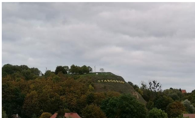
Zdj. 34 – Góra zamkowa z pozostałościami murów z XIV wieku.