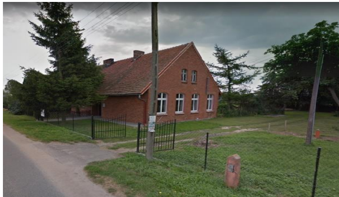
Zdj. 10 – Dawna szkoła z ok. 1912 roku.

We wsi znajduje się między innymi zachowany budynek dawnej szkoły z ok. 1912 roku (Zdj. 10).