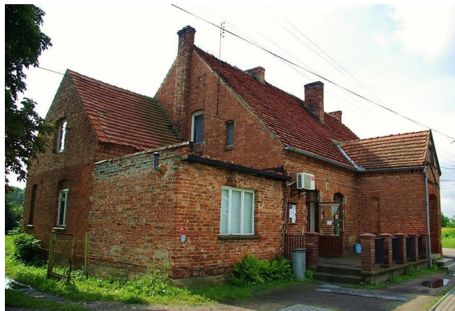
Zdj. 14 – Karczma z 2 połowa XIX wieku, przebudowany w XX wieku.