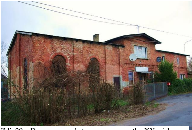
Zdj. 20 – Dom wraz z salą taneczną z początku XX wieku.

Wieś położona na gruntach należących do miasta Chełmna, elokowanych mieszczanom chełmińskim od 1602 r. W XVII w. osiedlili się tu także osadnicy holenderscy – menonici. W 1773 r. wieś liczyła 46 mieszkańców. W 1905 r. do wsi należało 166,3 ha gruntów, a do obszaru dworskiego Eichwald – 196,2 ha. We wsi była szkoła Podstawowa 2 – klasowa (w budynku drewnianym, nieistniejącym, opodal obecnego budynku szkolnego). Przynależność do parafii katolickiej w Chełmnie i ewangelickiej w Wielkich Łunawach (od 1885 r.). Na obszarze wsi znajdował się dom wraz z salą taneczną z początku XX wieku (Zdj. 20), a także dawna szkoła z ok. 1912 roku (Zdj. 21).