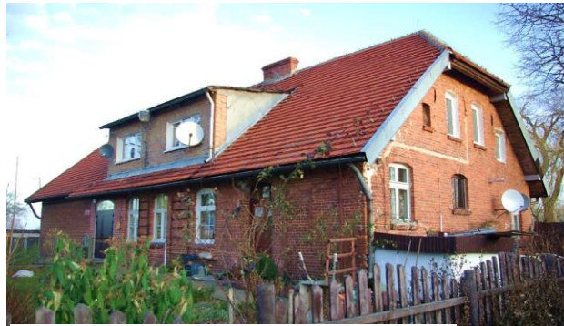
Zdj. 23 – Dawna szkoła z ok. 1913 roku.