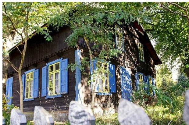
Zdj. 25 – Dom drewniany z 2 połowy XIX wieku.