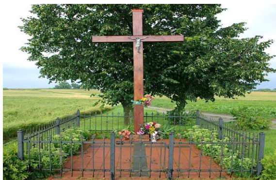
Zdj. 1 – Cmentarz choleryczny z 2 połowy XIX wieku.

Wieś o zabudowie skupionej, zagrody usytuowane po obu stronach drogi z Zakrzewa do Chełmna, po południowej stronie dawnej linii kolejowej ze Starogrodu. Na obszarze Osnowa występuje zachowany obiekt o wartości kulturowej – cmentarz choleryczny z 2 połowy XIX wieku (Zdj. 1).