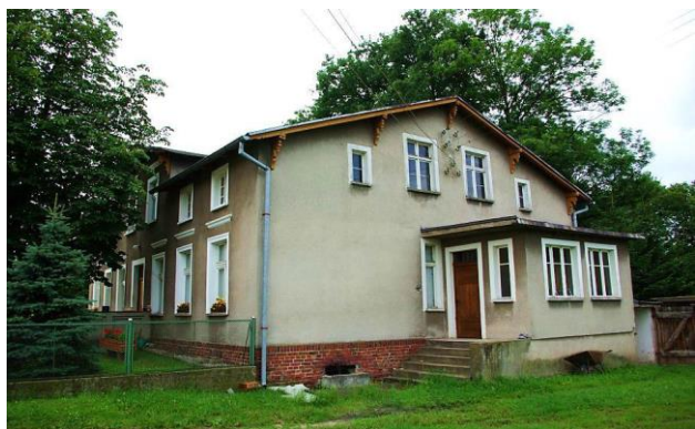
Zdj. 4 – Dom we wsi Borówno z 1873 roku.