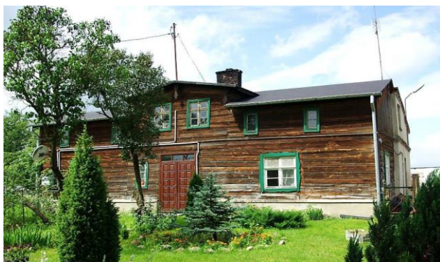
Zdj. 3 – Dom we wsi Bieńkówka z okresu 1 połowa XIX wieku.

Pierwotna wieś o zabudowie skupionej (w części położonej przy Wiśle). Zabudowa z okresu późnej kolonizacji, rozproszona w typie rzędówki bagiennej z zagrodami usytuowanymi w pewnej odległości po obu stronach drogi z Chełmna ku przeprawie przez Wisłę (widocznej na mapie z końca XVIII w.). Na obszarze wsi występują zachowane wartości obiekty o wartości kulturowej w tym zachowany dom z okresu 1 połowy XIX wieku (Zdj. 2), a także przydrożna kapliczka która stanowi jedną z wielu charakteryzujących kulturowo obszar Gminy (Zdj. 3).