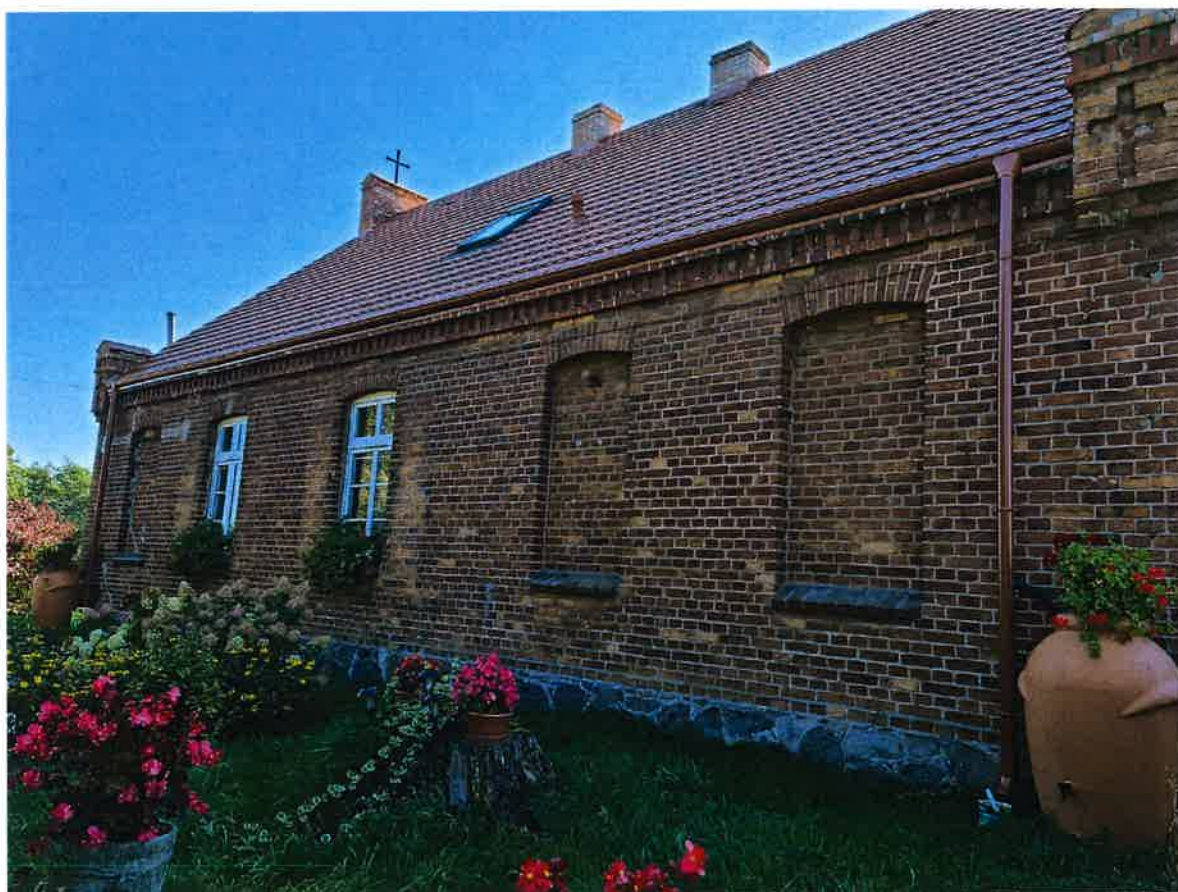
Zabytkowy budynek, dawna szkoła podstawowa. Obecnie część nieruchomości wykorzystywana jest jako świetlica wiejska.