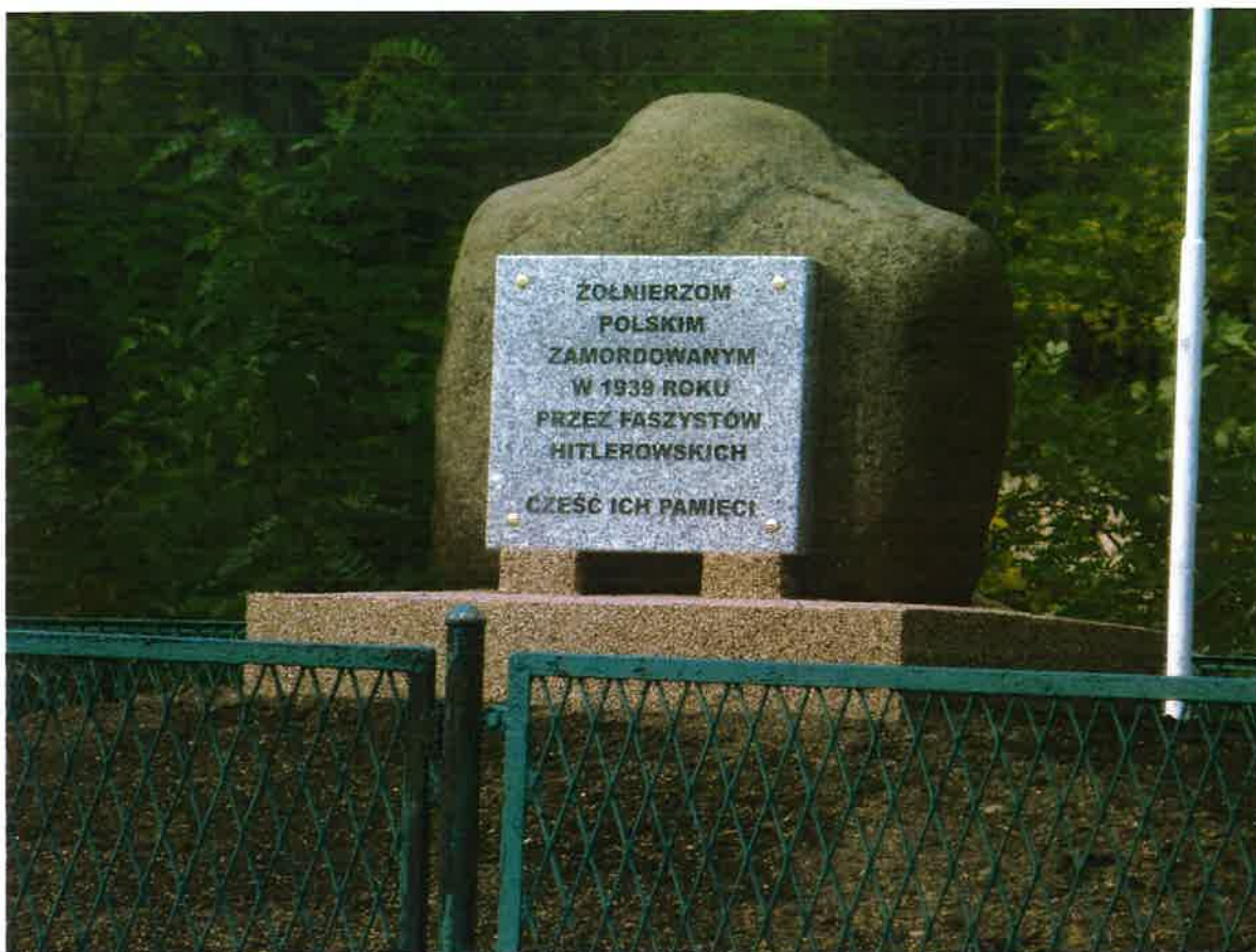
Pomnik w formie głazu z tablicą inskrypcyjną, poświęconą żołnierzom polskim zamordowanym w 1939 r. przez faszystów hitlerowskich.