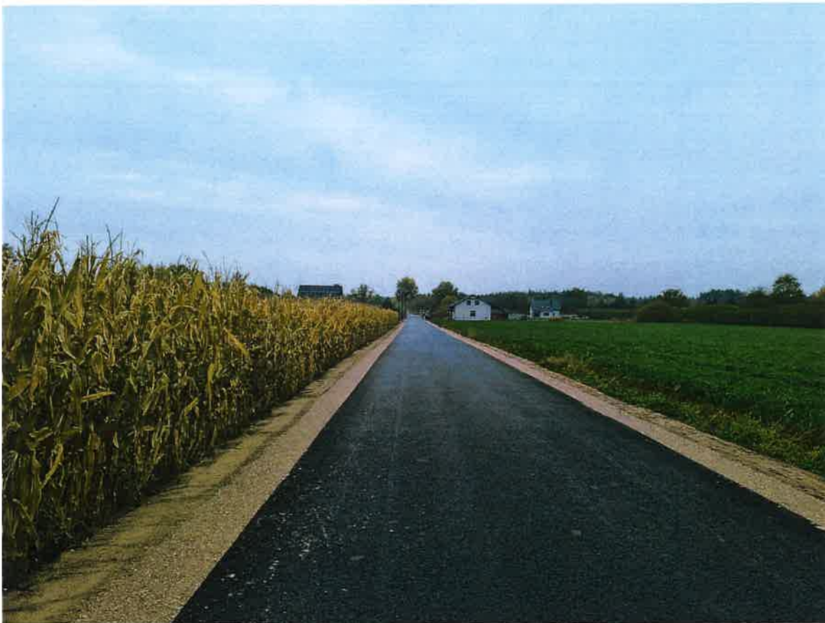
Przebudowana w 2020 r. droga gminna.