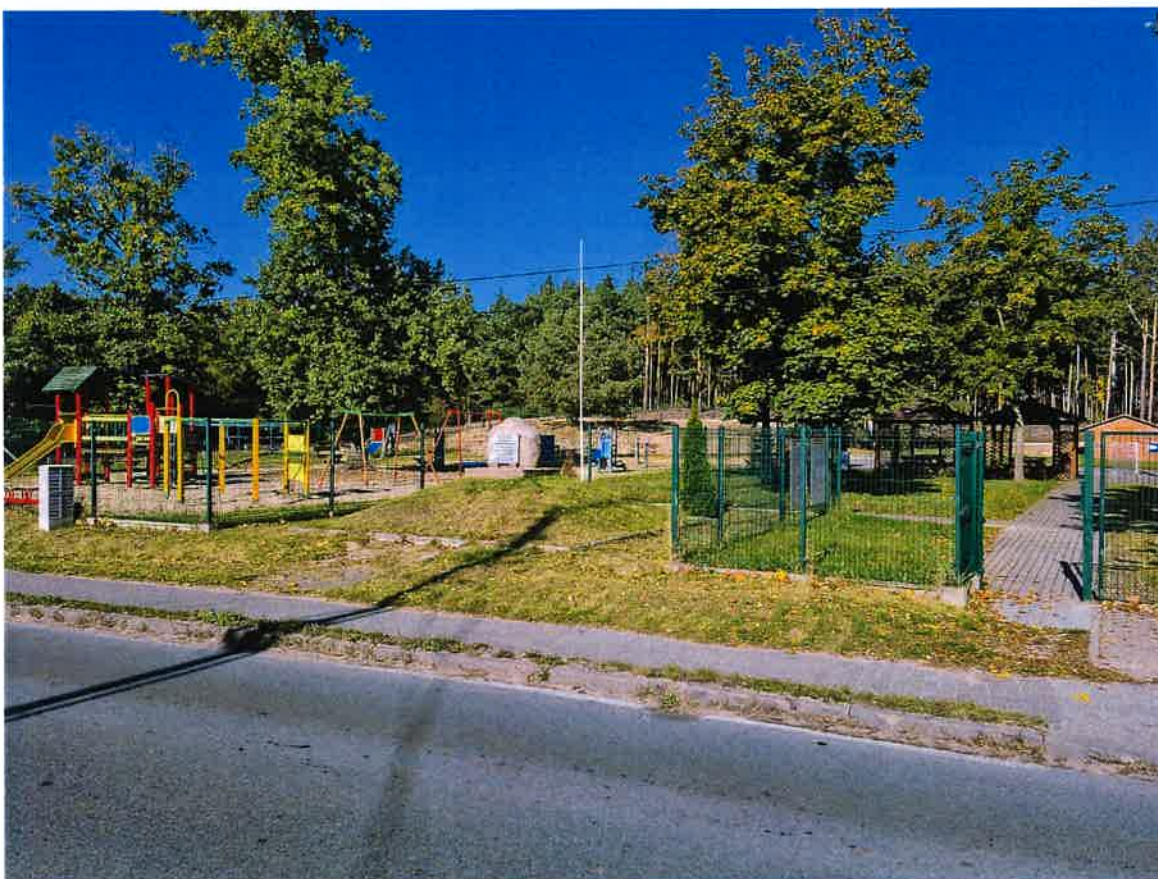
Miejsce rekreacji i wypoczynku.